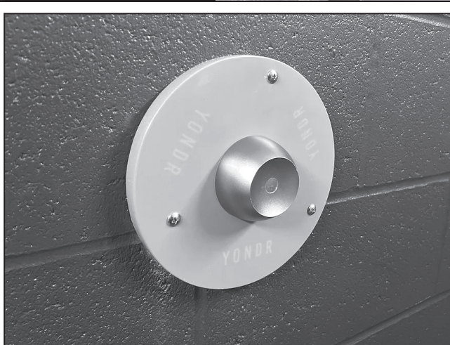
Dispositivos de bloqueo y desbloqueo montados en la pared cerca de las salidas de la escuela New Haven Academy

Ahora, cuando los alumnos entran a la escuela por la calle Orange, pasan por los detectores de metales y utilizan dos de los cinco cierres magnéticos de pared de la escuela para sus fundas, las que traen diariamente. El personal debe