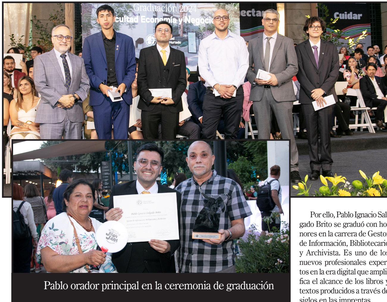
Pablo orador principal en la ceremonia de graduación

Sin embargo, en el 2025, se habla de una crisis de la lectura en medios de prensa y un abandono de los importantes libros. Pareciera que el teléfono celular. Las versiones resumidas de textos en el Internet estarían disminuyendo la cantidad de lectores.