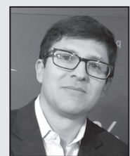
*Por ANGEL IRIGOYEN Columnista