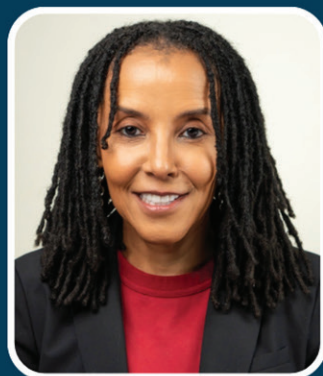
KICA MATOS President of the National Immigration Law Center & Immigrant Justice Fund