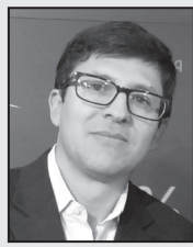
*Por ANGEL IRIGOYEN Columnista